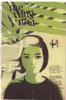
Áp phích bộ phim "Mẹ vắng nhà" (Hàng phim Truyện Việt Nam, 1980)

Bộ phim từng đoạt giải thưởng Bông sen vàng tại Liên hoan phim Việt Nam vào năm 1980, cùng với Cánh đồng hoang của đạo diễn Hồng Sến. Không những thế, cả Cánh đồng hoang và Mẹ vắng nhà còn đoạt hai giải thưởng quốc tế quan trọng tại Liên hoan phim Mát-xcơ-va (Moscow, Nga) và Ca-lo-vi Va-ri (Karlovy Vary, Tiệp Khắc). Cả hai đều có bối cảnh vùng sông nước Nam Bộ, nơi những con người bình thường, ngay cả những đứa trẻ nhỏ bé cũng phải sống trong cảnh nguy hiểm dưới bom đạn của quân đội Mỹ... Tuy nhiên, điều đặc biệt là cả hai bộ phim đặc sắc nói trên không mô tả sự mất mát, đau thương của người dân Việt Nam mà là bản anh hùng ca lãng mạn, là vẻ đẹp tràn ngập biểu tượng và chất thơ