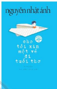
Ảnh trang bìa cuốn sách “Cho tôi xin một vé đi tuổi thơ”

Mỗi ngày mới trong thế giới kì diệu kia, là lòng thay, đều bắt đầu bằng những lời than thở: “Một ngày, tôi chợt nhận thấy cuộc sống thật là buồn chán và tẻ nhạt”. Tuy nhiên, cái tẻ nhạt và buồn chán ấy không phải là cảm giác vô vị, bất lực trước cuộc đời mà nó thuần túy chỉ là về chán ngán bởi phải thực hiện hàng tá những hành động lặp đi lặp lại: tỉnh giấc, ăn sáng, đi học, ngủ trưa, đi học rồi lại học bài, đi ngủ và tỉnh giấc. Bởi vậy, cậu bé quyết định sẽ lấp đầy những ngày buồn tẻ bằng những “phi vụ” nghịch ngợm mà cũng hết sức đáng yêu. Bắt đầu từ trò chơi giả bộ làm phụ huynh, rồi tới việc đặt tên đồ vật bằng những cái tên chẳng-liên-quan-tạo-nào, chưa kể tới việc