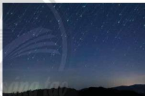
Một cơn mưa sao băng

Mỗi năm có rất nhiều trận mưa sao băng. Sau đây là gợi ý cho bạn về một số trận mưa sao băng hằng năm có mật độ sao tương đối cao: