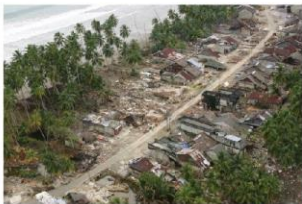
Một ngôi làng ven bờ biển Su-ma-tra đổ nát sau thảm họa sóng thần ngày 26/12/2004 ( https://cand.com.vn/Muon-mau-cuoc-song/Tran-song-than-tan-khoc-nhat-lich-su-1494422/ )

chết tại vịnh Mo-ro (Moro), Phi-lip-pin (Philippines) vì sóng thần. Ngày 17/7/1998, sóng thần làm hơn 2 100 người chết tại Pa-pua Niu Ghi-nê (Papua New Guinea) 1 .