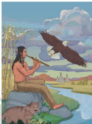
Người da đỏ sống hoà hợp, gần gũi với thiên nhiên

Ồ thành phố của người da trắng, chẳng có nơi nào là yên tĩnh cả, chẳng có nơi nào là nghe được tiếng lá cây lay động vào mùa xuân hay tiếng vỗ cánh của côn trùng. Nếu có nghe thấy thì đó cũng là những tiếng ồn ào lảng mạn 1 trong tai. Và cái gì sẽ xảy ra đối với cuộc sống, nếu con người không nghe được âm thanh lẻ loi của chú chim đập mồi hay tiếng tranh cãi của những chú ếch ban đêm bên hồ? Tôi là người da đỏ, tôi thật không hiểu nổi điều đó. Người Anh-điêng 2 chúng tôi ưa những âm thanh êm ái của những cơn gió thoảng qua trên mặt hồ, được mưa gõ rũa và thấm đượm hương thơm của phấn thông.