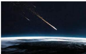
Sao băng

Khi quan sát những trận mưa sao băng, chúng ta đều có thể dễ dàng nhận thấy các sao băng đều xuất phát hoặc hướng về một khu vực trên bầu trời. Khu vực đó được gọi là tâm điểm của mưa sao băng. Tên của các trận mưa sao băng sẽ được đặt theo tên khu vực chòm sao mà tâm điểm của trận mưa sao băng đó hướng tới. 2